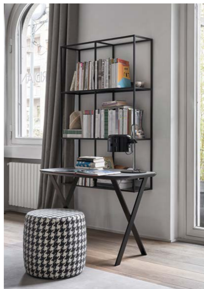
CHARLOT pouf BURT scrittoio . writing desk HARDY pensile . wall unit