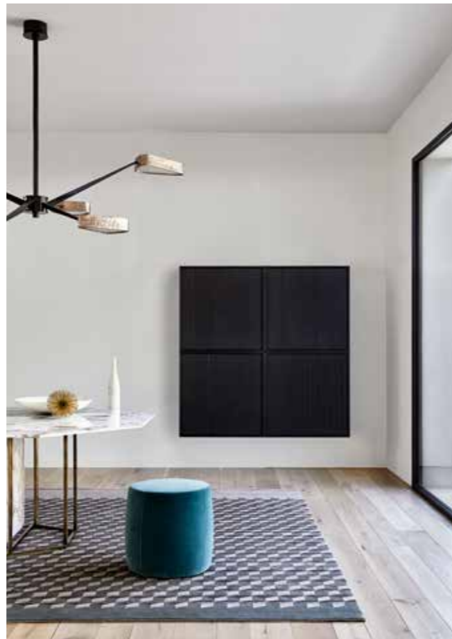
AMADEUS pensile . wall unit PLINTO tavolo . table CHARLOT pouf