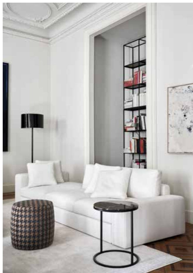
HAROLD divano componibile . modular sofa HAROLD cuscini . cushions classic 80, deco 50 PEK tavolo basso . low table CHARLOT pouf