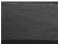
Eiche ohne Knoten pigmentiert: total black