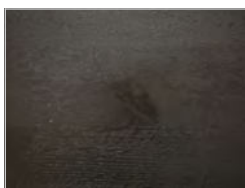
Eiche mit Knoten pigmentiert: total black