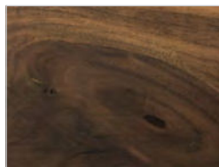
Nussbaum mit Knoten