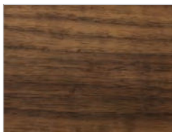
Nussbaum ohne Knoten