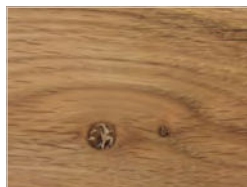
Eiche mit Knoten